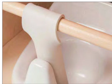
Tabla para pies que previene el movimiento de la silla