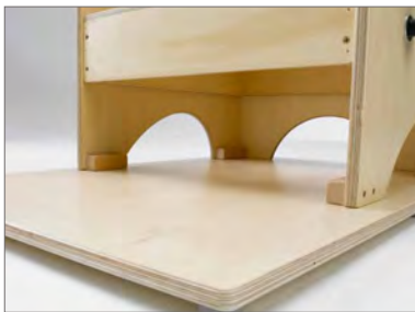
Tabla para pies